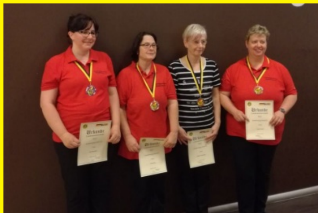
Damen - Ranglistenklasse E /F