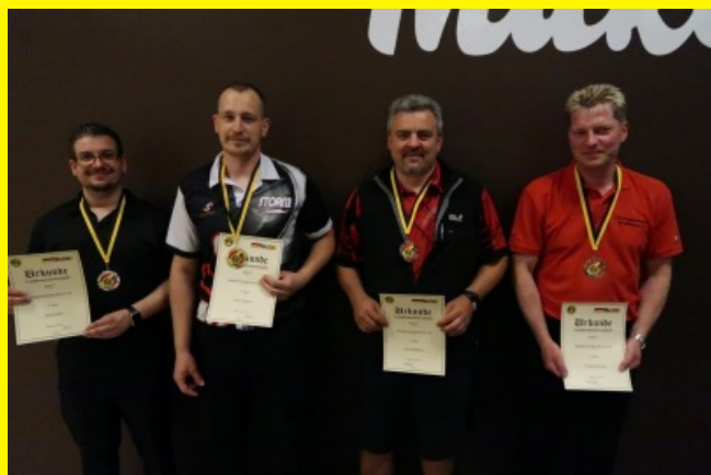
Herren - Ranglistenklasse A/B