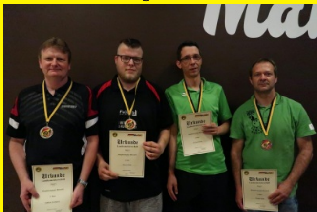
Herren - Ranglistenklasse D