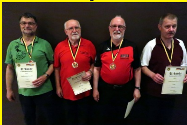
Herren - Ranglistenklasse E /F