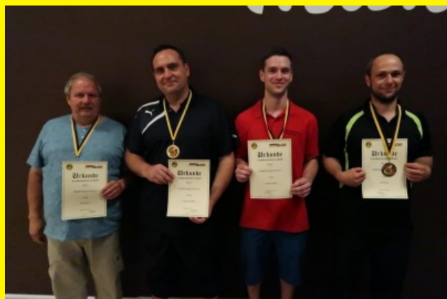
Herren - Ranglistenklasse C