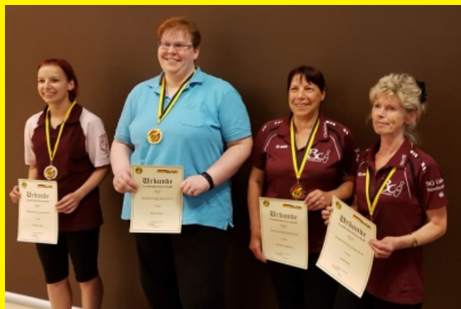
Damen - Ranglistenklasse B/C/D